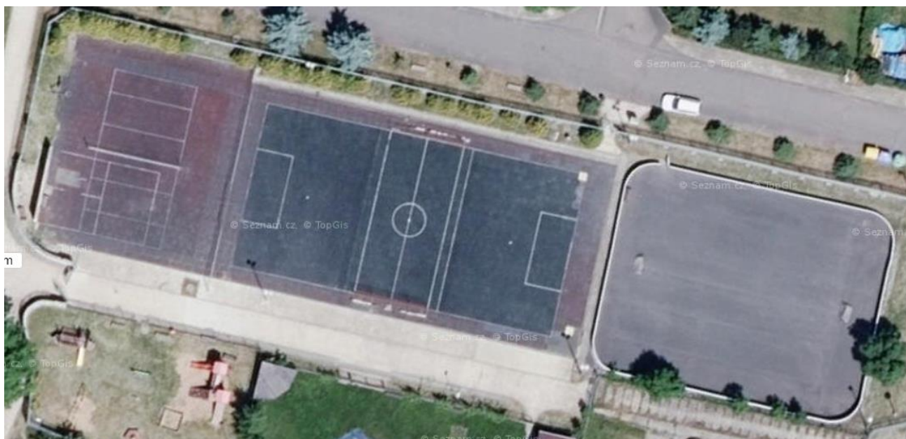
Obrázek 2: Stávající stav

Zázemí sportoviště (šatny, sprchy, WC) zcela chybí. Tento stav podstatně zhoršuje podmínky pro využití sportovní infrastruktury a konání větších akcí (turnaje, zápasy, soustředění/akademie atp.). Stávající stav neumožňuje pořádání turnajů juniorských soutěží, problematické je využití i pro tréninkové aktivity. Tento stav snižuje atraktivitu sportu a pohybu obecně (nemožnost se převléknout, bezpečně si uložit věci atp.). Také přístupové plochy jsou nevyhovující (poškozeny obrusem, místy chybí, patníky jsou rozpadlé, neefektivní odvodnění ploch).